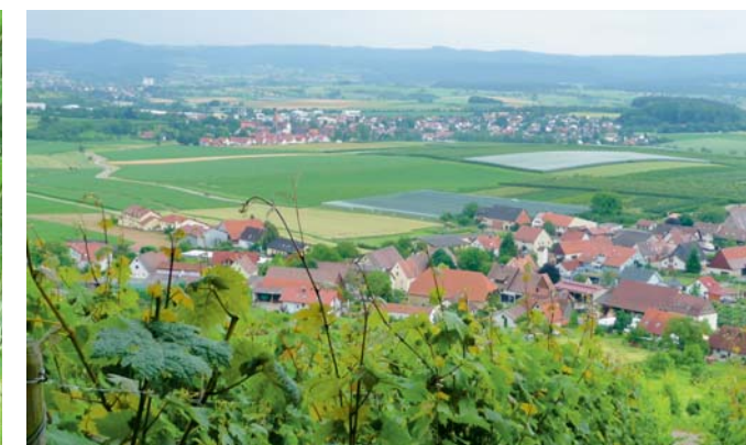
Stairway to heaven